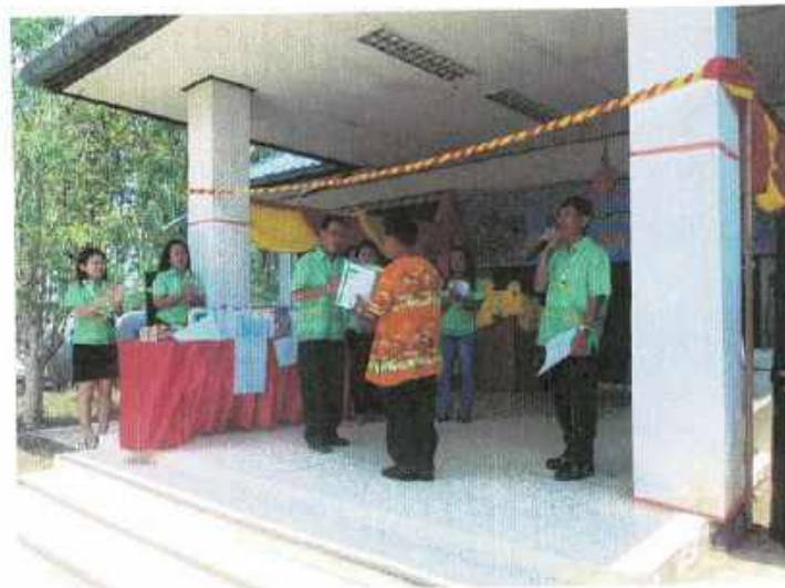
มอบรางวัลเป็นกำลังใจแก่ผู้แสดงความสามารถ