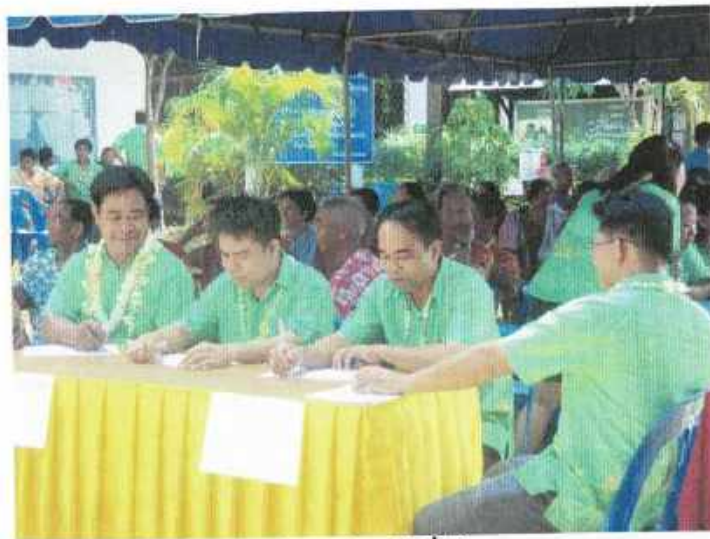
คณะกรรมการตัดสินทำหน้าที่ให้คะแนน