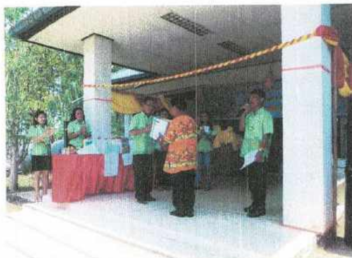
มอบรางวัลเป็นกำลังใจแก่ผู้แสดงความสามารถ