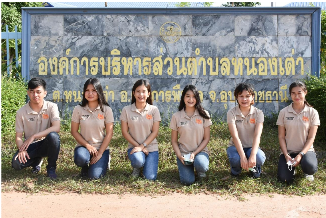
ภาพที่ 1.4 ทีมงานนักวิจัย ลงพื้นที่แจกแบบสอบถามในเขต อบต.หนองเต่า อ.ตระการพืชผล (2)