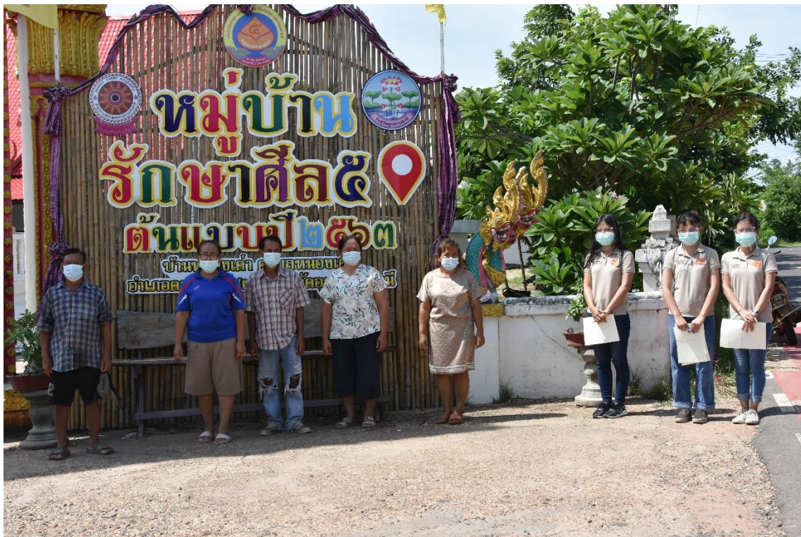
ภาพที่ 1.6 ทีมงานนักวิจัย ลงพื้นที่แจกแบบสอบถามในเขต อบต.หนองเต่า อ.ตระการพืชผล (4)